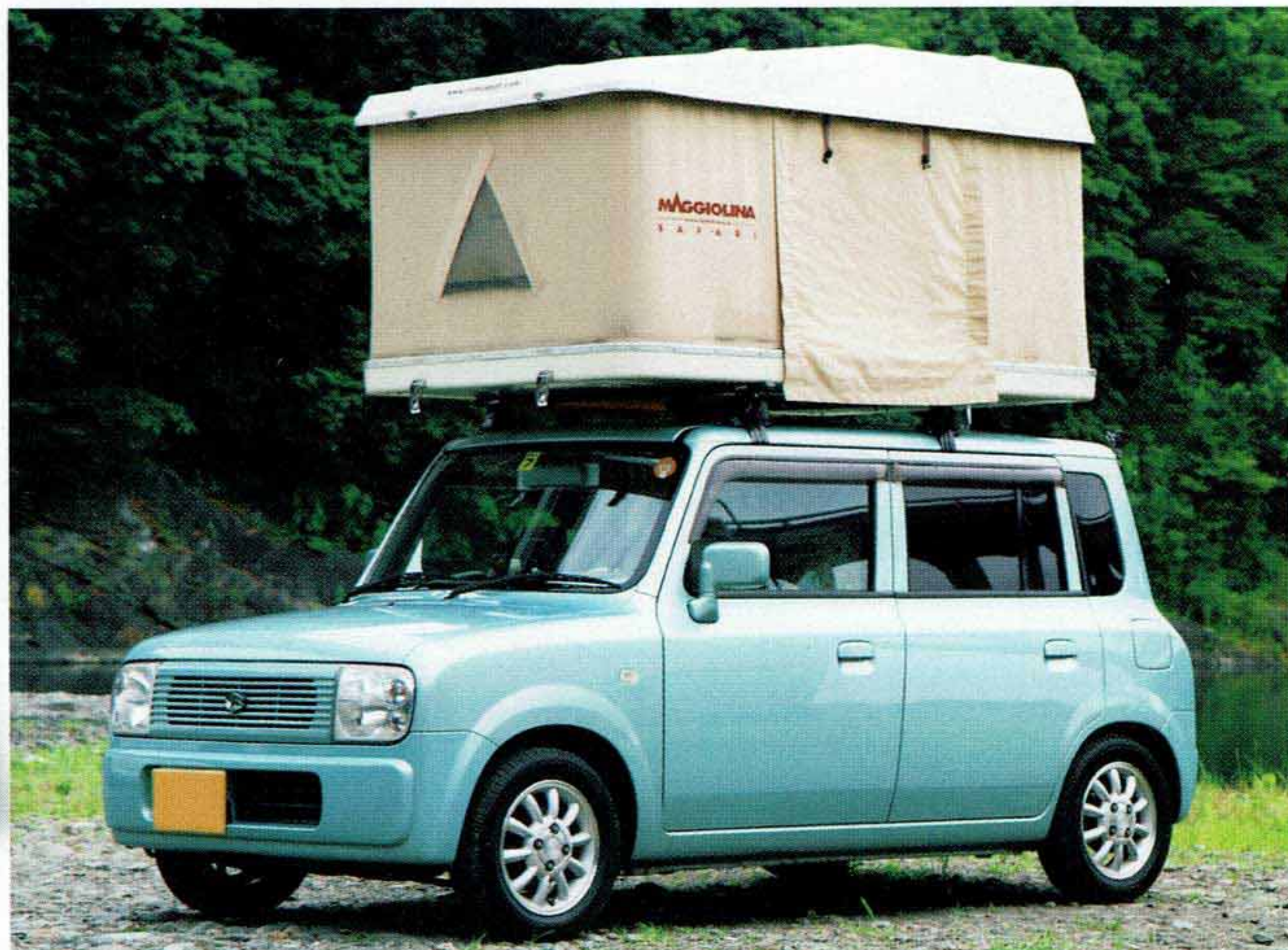
テントを収納する本体カバーはFRP製。クルマへの装着は汎用ルーフキャリアを使う。前後ルーバーの間隔が70cm以上取れば軽自動車にも装着できる